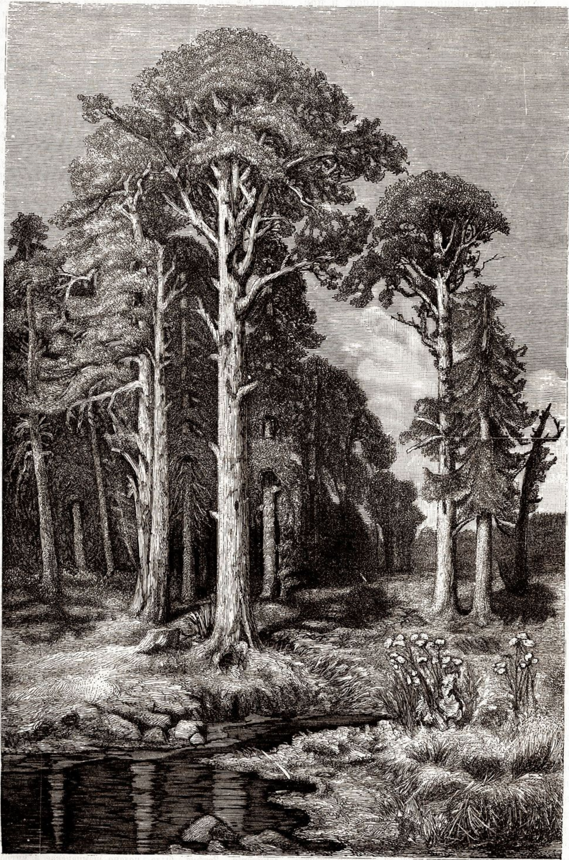
Въ монастырскомъ лѣсу