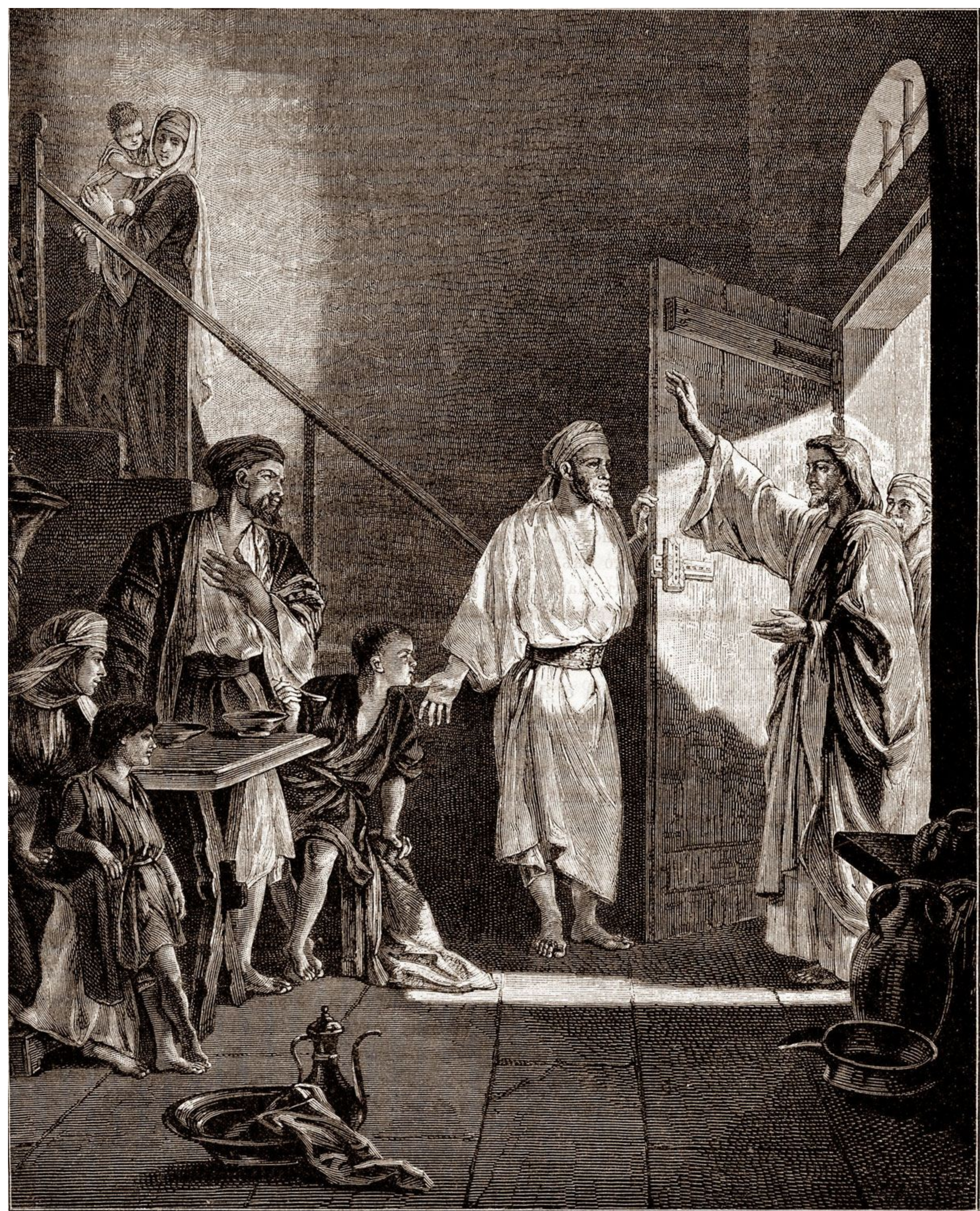
Христось приходитъ къ Симону.