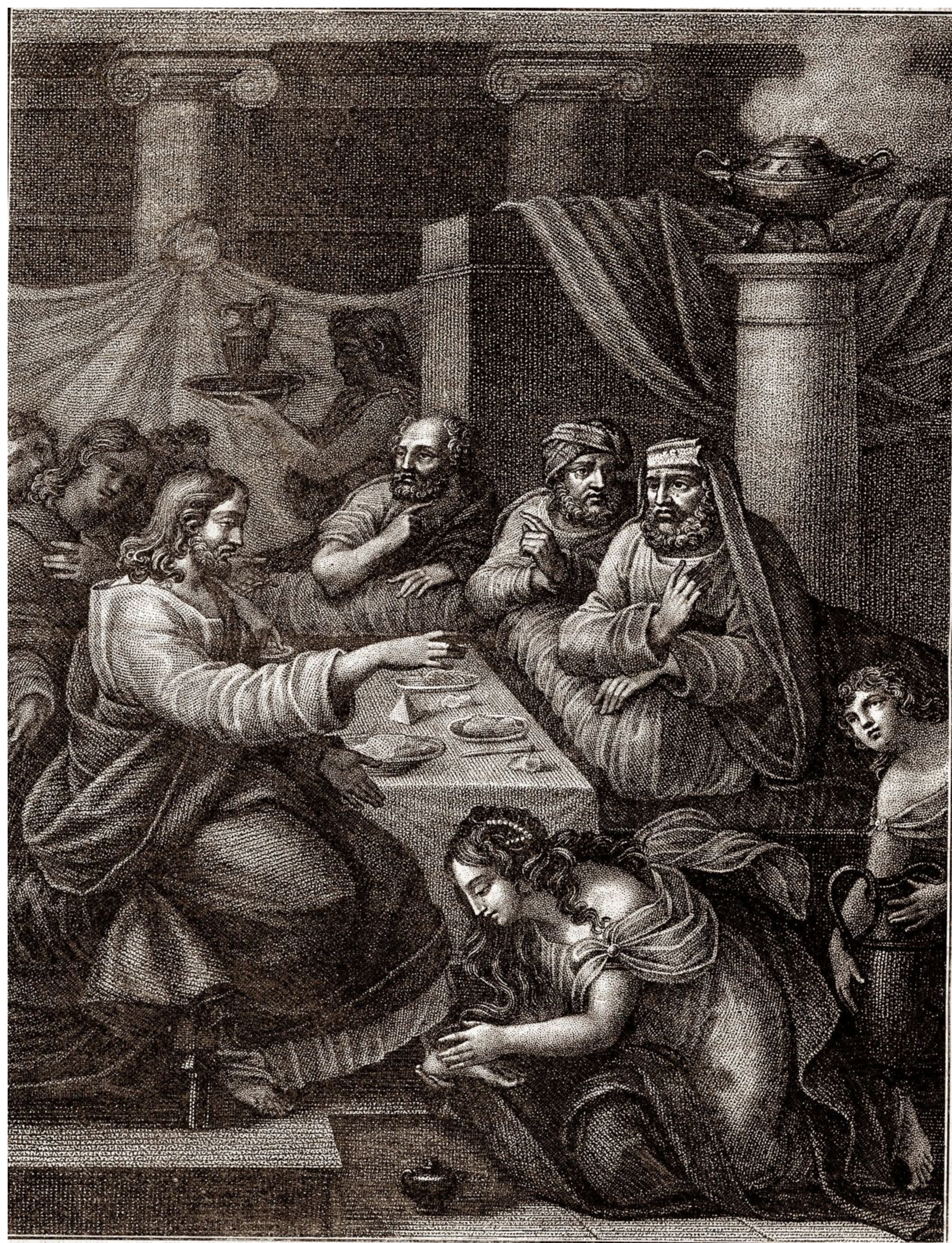
Грѣшница у ногъ Иисуса Христа въ домѣ Симона.