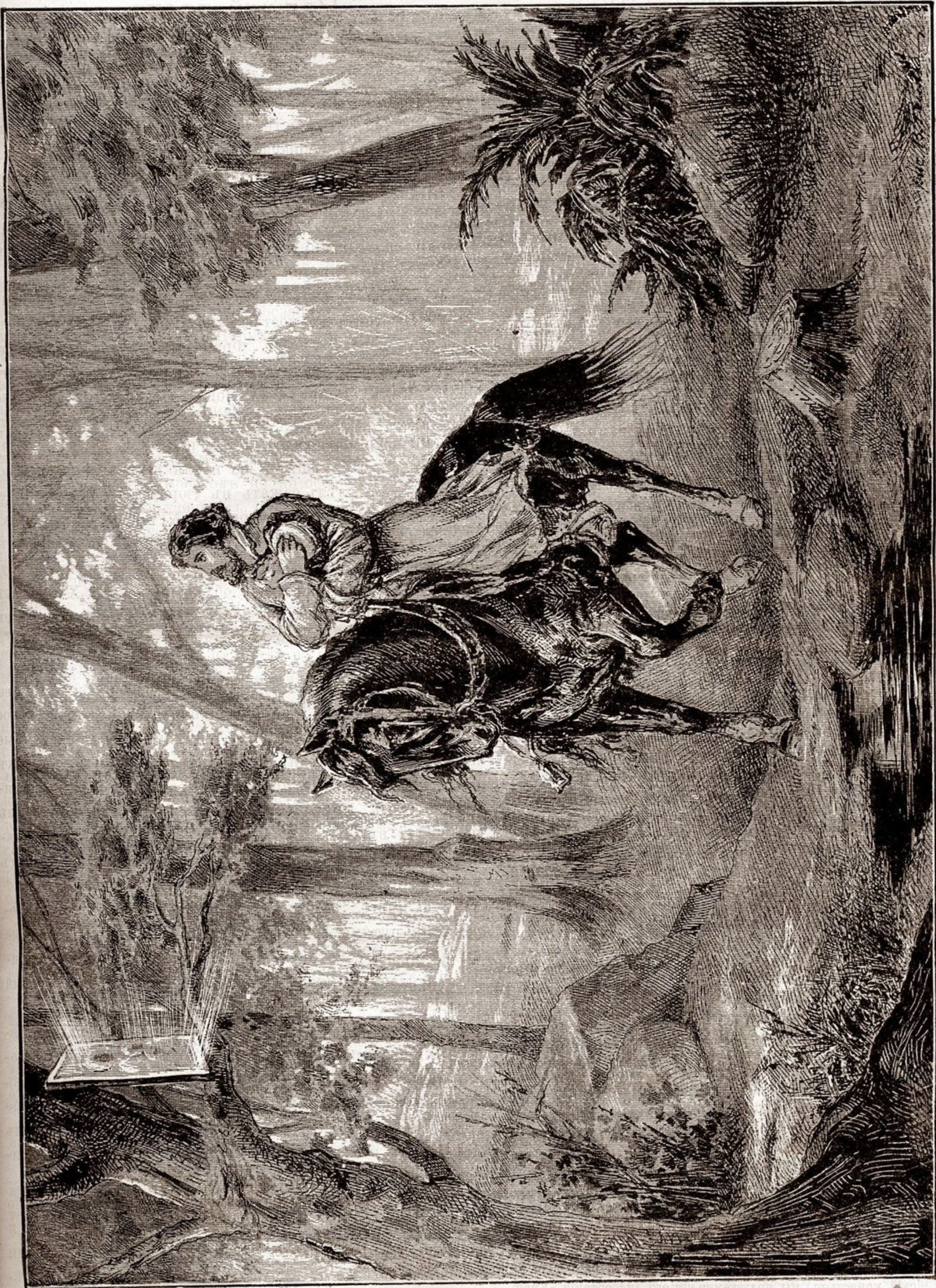
Обръщеніе Теодоровской иконы Божіей Матери. (Къ статьѣ на стран. 152—154).