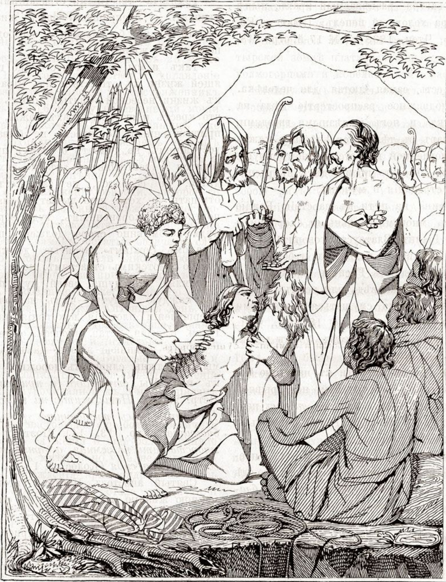
Братья продаютъ Іосифа.

богатство отнимается отъ насъ, мы должны благодушно и съ покорностію волѣ Божіей переносить это лишеніе, говоря вмѣстѣ съ праведнымъ Іовомъ: Господь даде, Господь отъятъ: яко Господеви изволися, тако бысть: буди имя Господне благословенно во вѣки (Іов. 1, 21). Хвалить-ли насъ и удостоиваютъ почестей, — намъ не должно самоуслаждаться, но принимать это со смиреніемъ, памятуя заповѣдь Спасителя: Болій въ васъ да будетъ яко мній, и старій, яко служай (Лк. 22, 26). О насъ разносятъ худую молву и осыпаютъ безчисленными злосло-